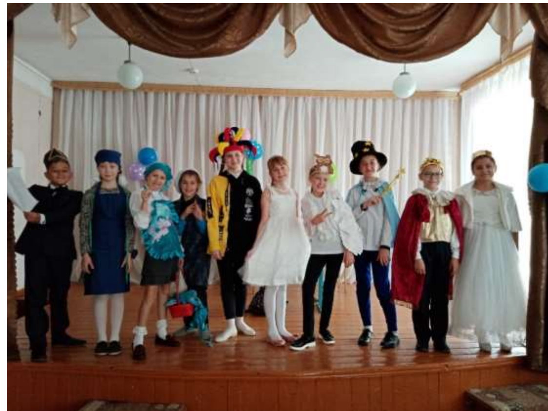
5класс, театральная творческая группа «Современник»