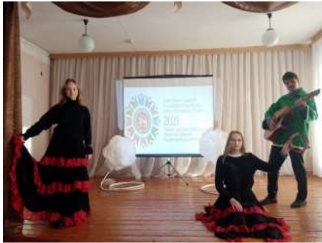
Цыганский танец, 8 класс.