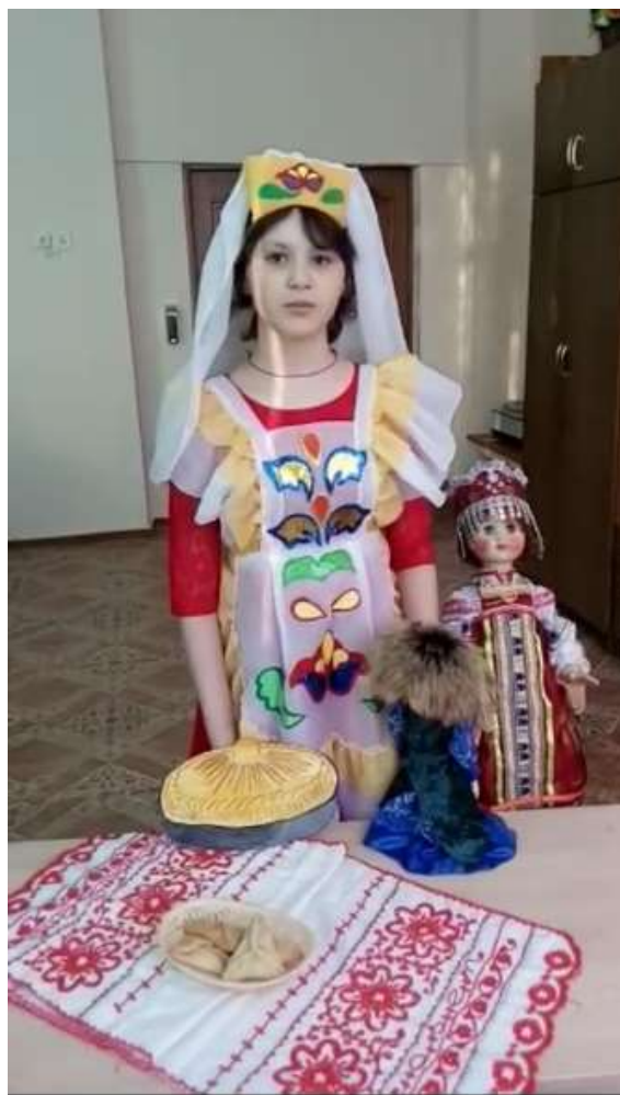
4 класс «Әниемнән өйрәнәм»