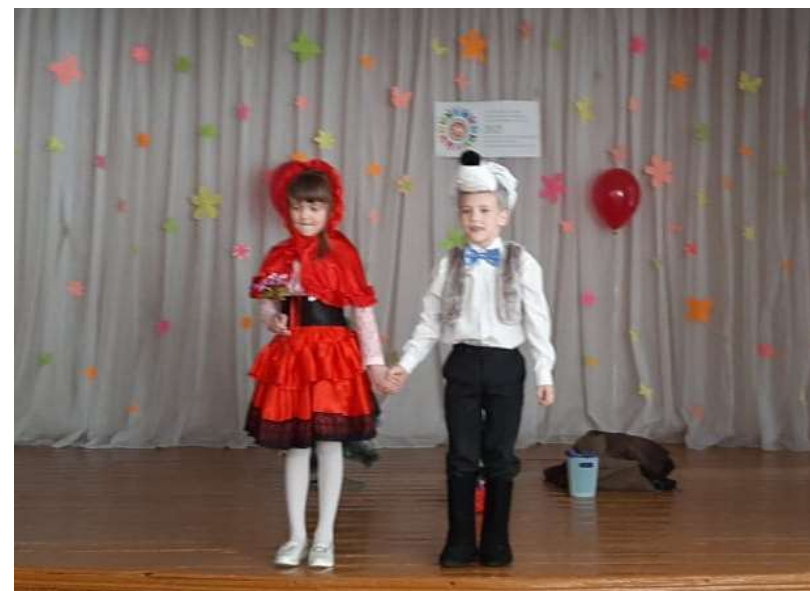
2 класс, Габдулла Тукай “Кәжә белән Сарык”