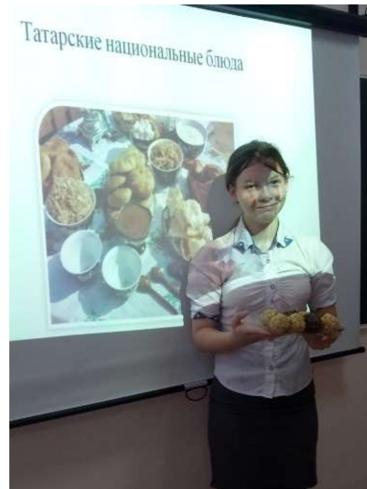
7 класс “Чәк-чәк пешерү серләре”