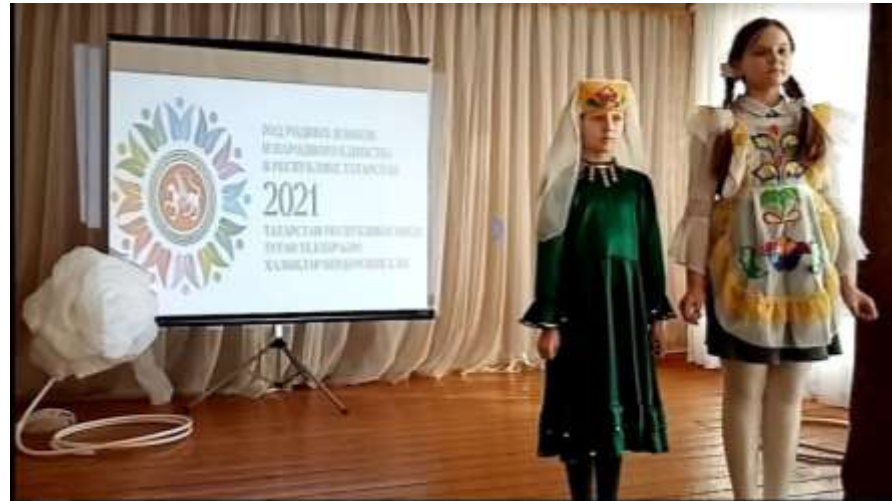
Стихи на родном языке, 4 класс