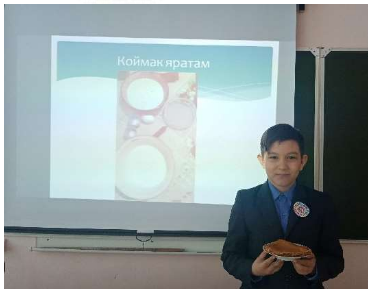
5 класс Коймакны табынга мин үзем таратам. Кунакка килегез! – Мин коймак яратам.