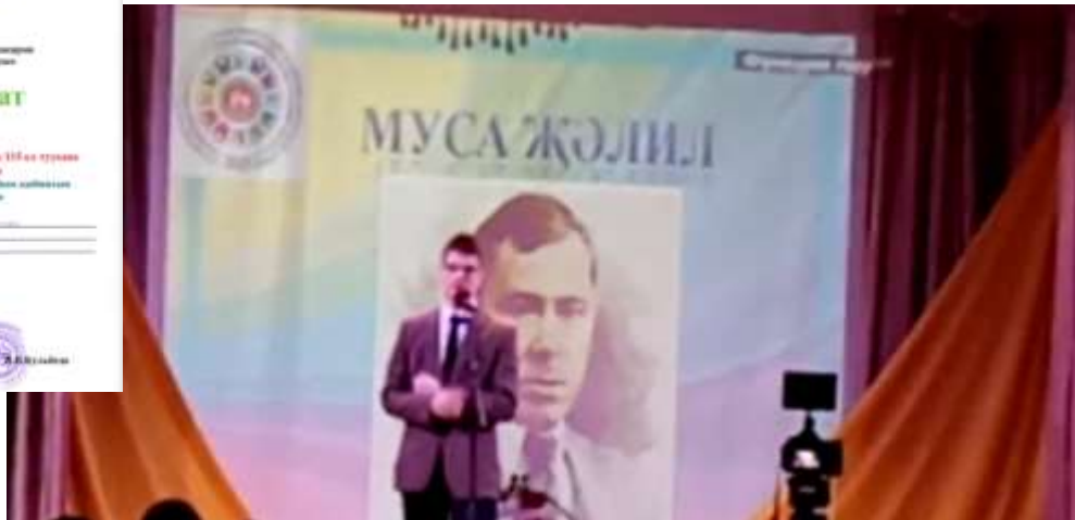
Конкурс чтецов, посвященный 115- летию татарского поэта М. Джалиля «Мин-патриот»

Оформление тематического стенда, посвященного 115-летию татарского поэта М.Джалиля “Стихи мои – свидетели живые...”