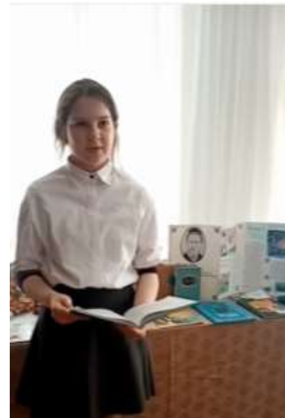
5 кл. Иванова К. «Туган тел» на ангяз