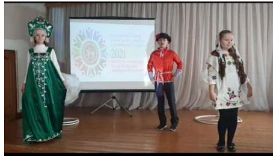
Русские народные частушки, 6 класс