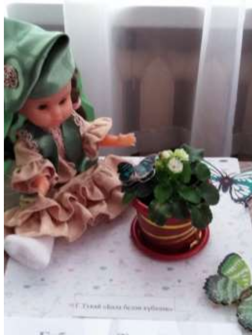
“Бала белән күбәләк”