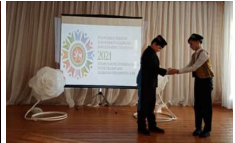
Приветствие на разных языках, 3 класс