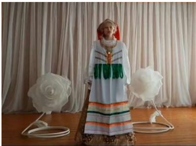
Песня на чувашском языке