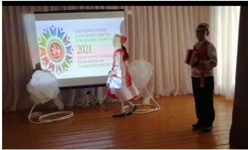
Татарский народный танец, 5 класс