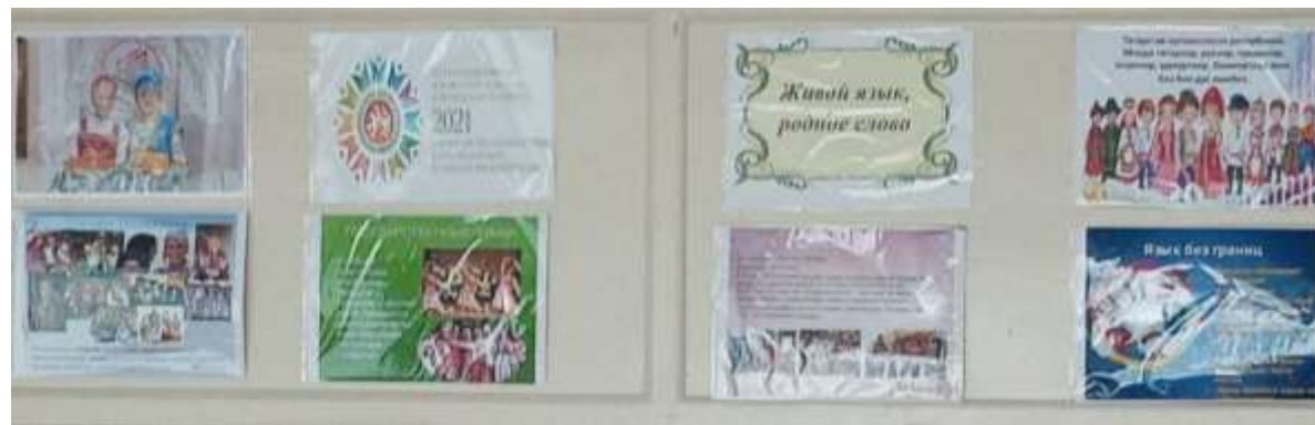
Оформление информационного стенда «Каждому из нас родной язык дорог»