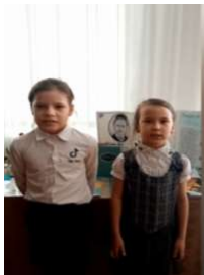
2 кл «Туган тел»