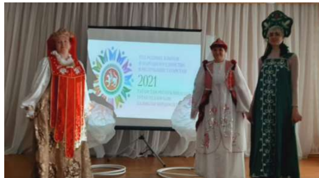
Стихи на разных языках среди учителей