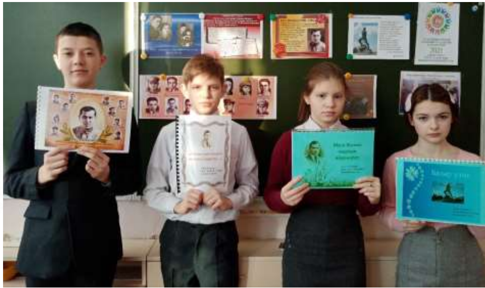
Литературный марафон «Муса Жәлилне укыйбыз»