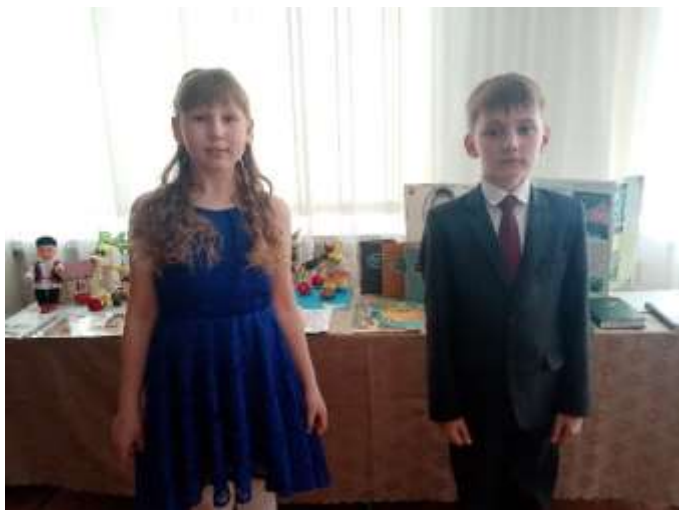
3 кл. Г.Тукай “Бала белән күбәләк”